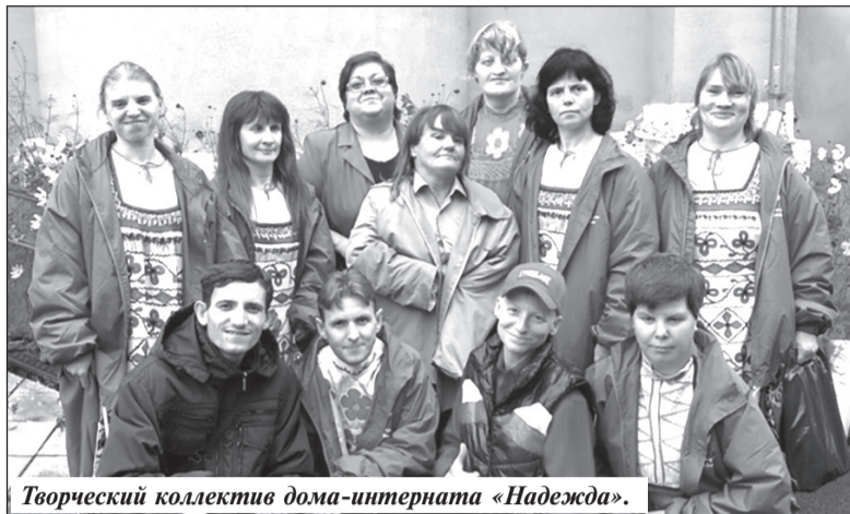
Творческий коллектив дома-интерната «Надежда».

блоками и уютными столовыми, библиотеками, актовыми залами. При уходе учитываются все потребности пожилых, начиная от полноценного четырехразового сбалансированного питания и заканчивая оздоровительными процедурами. Здесь работают опытные врачи и медсестры, следящие за состоянием каждого подопечного, психологи, повара, массажисты и социальные работники. Они делают все возможное, чтобы каждый был обеспечен необходимым и получал достойный уход. Подопечные живут в уютных одно- и трехместных комнатах, оснащенных необходимой мебелью и мягким инвентарем, где воссоздана привычная для них домашняя атмосфера – с вышивками, календарями, цветами в горшках.